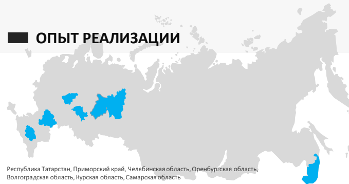
Республика Татарстан, Приморский край, Челябинская область, Оренбургская область, Волгоградская область, Курская область, Самарская область